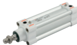
ISO 15552 Zylinder Reihe HCR, mit hoher Korrosionsbeständigkeit, Durchmesser von 32 bis 125mm

ISO 6432 stainless steel cylinders, diameters from 16 to 25 mm