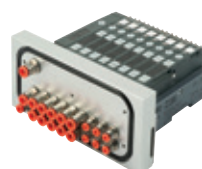
Ventilinsel für den Spritzbereich in der Lebensmittelindustrie, Reihe HDM, EB 80, von 4 bis 16 Ansteuerungen

Round stainless steel cylinders, diameters from 32 to 63 mm