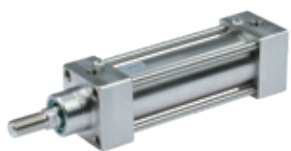
ISO 15552 Edelstahl Zylinder, Durchmesser von 32 bis 125 mm

ISO 15552 cylinders Series HCR, High Corrosion Resistance, diameters from 32 to 125 mm