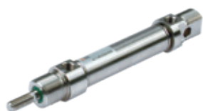
ISO 6432 roestvaststaal cilinder, diameters 16 tot 25 mm

ISO 6432 stainless steel cylinders, diameters from 16 to 25 mm