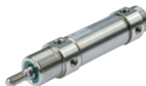
Roestvaststalen rondcilinder, diameters 32 tot 63 mm

Filters and regulators for water, BIT Series F, 1/8" and 1/4" connections